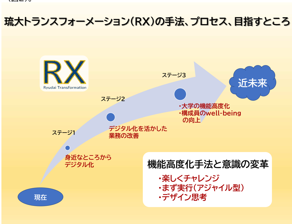
図2. 琉大トランスフォーメーション(RX)の手法、プロセス、目指すところ